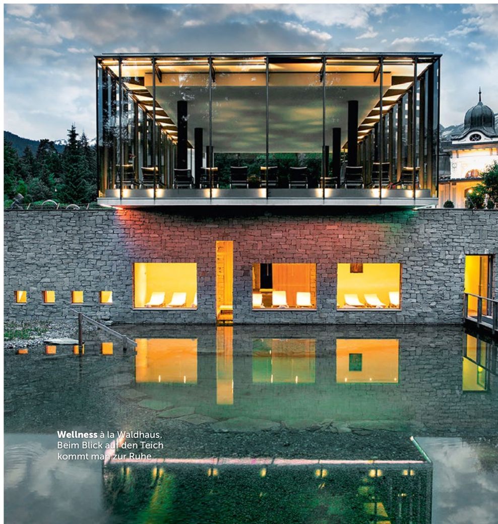
Wellness à la Waldhaus. Beim Blick auf den Teich kommt man zur Ruhe

Seerose Resort & Spa: Day-Spa light ohne Behandlung Mo–Fr 79 Fr., So und Feiertage 89 Fr., z. B. Thai Sunday mit Abendessen im Restaurant Samui-Thai 149 Fr. oder Day-Spa mit 60-minütiger Thai-Massage Mo–Fr 180 Fr., So und Feiertage 210 Fr. seerose.ch