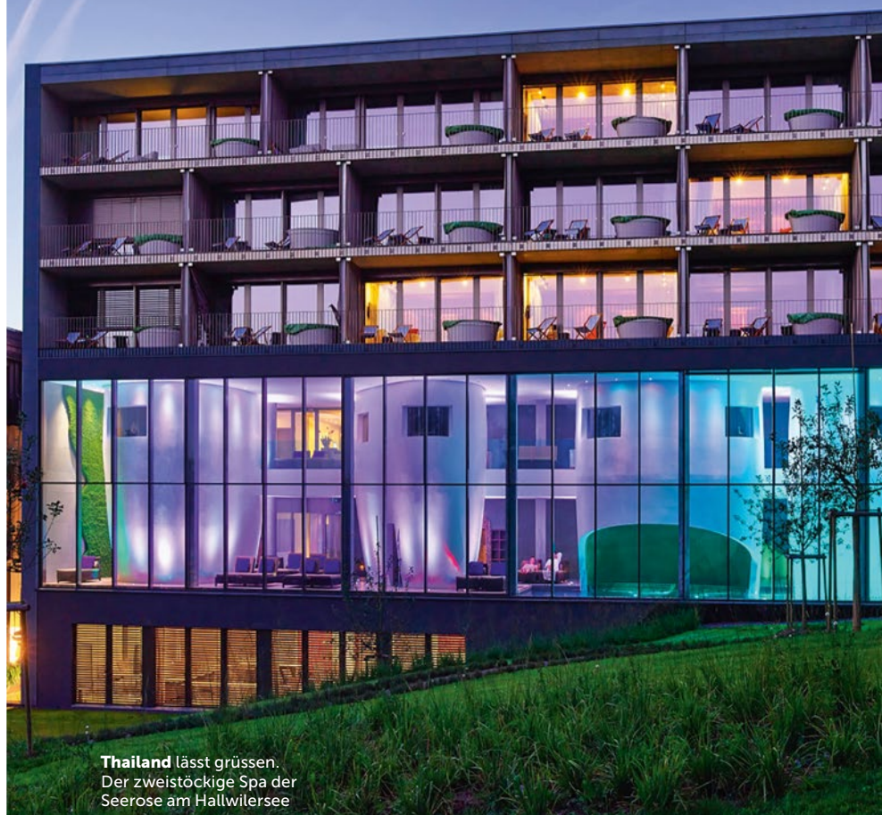
Thailand lässt grüssen. Der zweistöckige Spa der Seerose am Hallwilersee