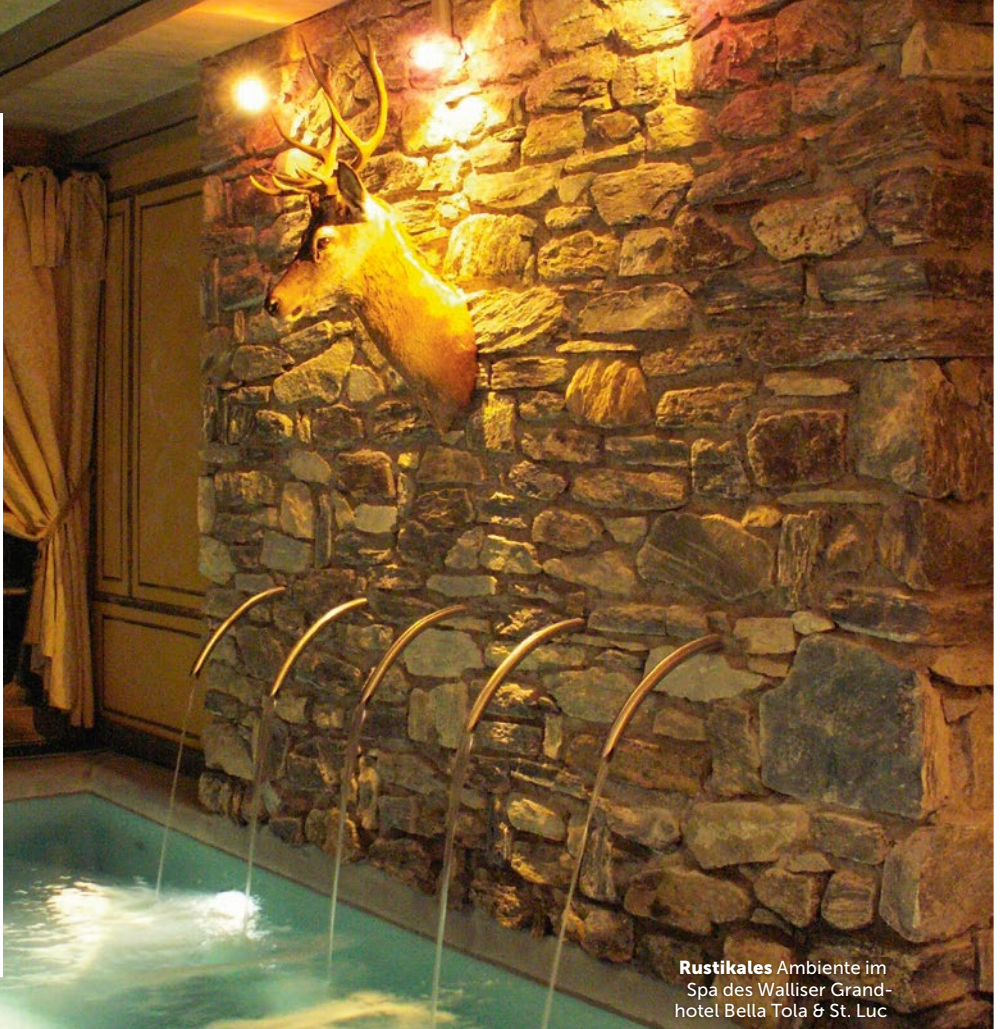
Rustikales Ambiente im Spa des Walliser Grand- hotel Bella Tola & St. Luc

Grand Hotel Bella Tola & St-Luc: Spa-Tag «Dem Alltag entfliehen» mit Kaffee, Croissant, Lunch, Mineralwasser und Kaffee, 30-Minuten-Massage, Kaffee/Tee und Tarte und Geschenk 179 Fr. bellatola.ch